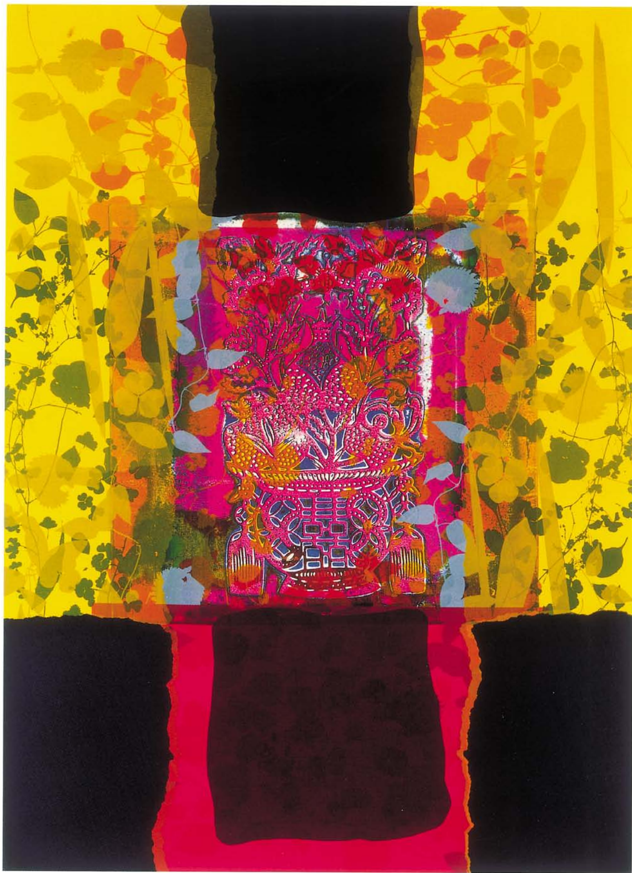
心情系列 併用版畫 75×110cm×3幅 1999