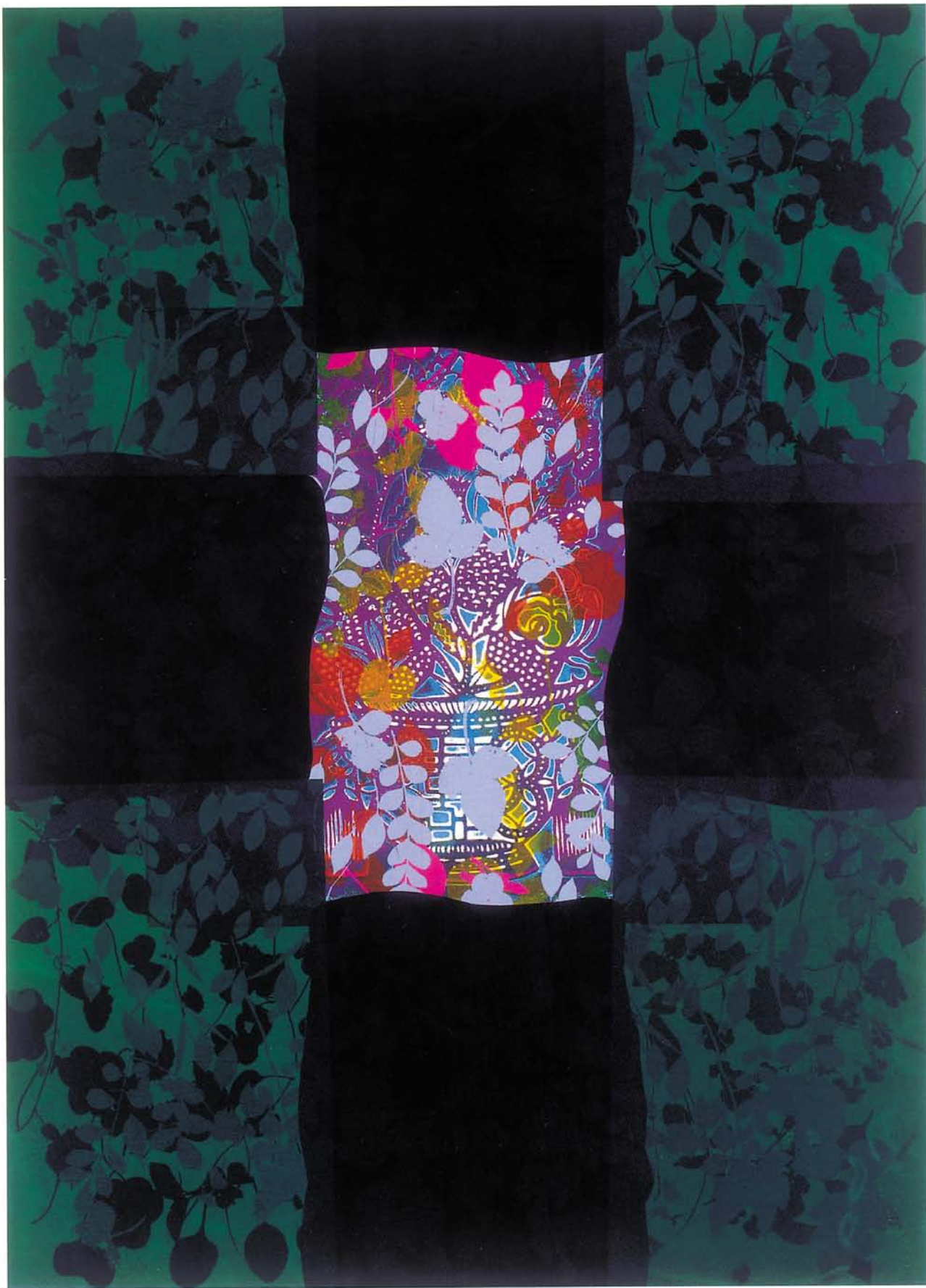
心情系列 併用版畫 75×110cm×3幅 1999